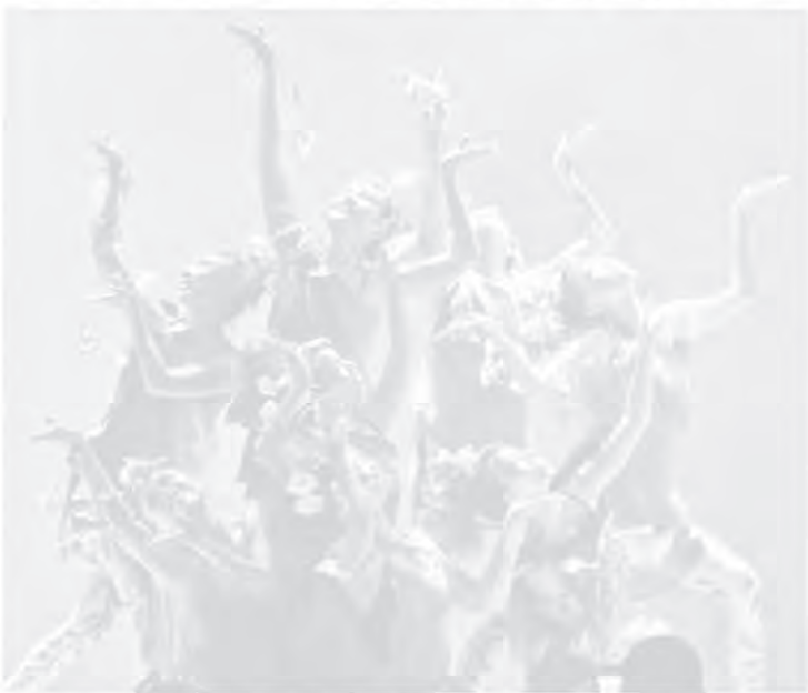
舞蹈工厂艺术学院将在 1 月 3 日举办开放日，欢迎北马喜爱舞蹈艺术的人士踊跃出席参观!

蹈学院，以及现代舞推广中心。学生经过学习后，将能获得广受承认的证书。舞蹈工厂艺术学院的地址为 Desa Universiti 4C16C1-1st Floor, Jalan Sungai Dua, 11700 Penang (理大双溪梳旁，麦当劳楼上)，联系电话：016-477 0990。#