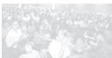
日新独中新生始业辅导营家长交流会场面热烈。

他指出，为进一步稳固该校的经济基础，从 2009 年开始，该校已经停止给予政府考试成